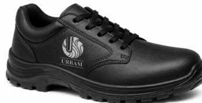
Exemplo de Gravação em Serigrafia