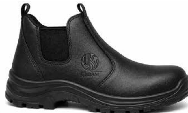
Exemplo de Gravação em Baixo Relevo

O calçado de EPI deverá ser fornecido com personalização da logomarca da Urbam em baixo relevo, serigrafia ou laser na medida 3,0 X 3,0 CM, aplicada de forma permanente e visível. A personalização deverá apresentar elevada resistência às condições normais de uso do calçado, incluindo abrasão, flexão, umidade, exposição solar, agentes de limpeza e demais fatores inerentes às atividades laborais. A estampa não poderá apresentar descolamento, descascamento, rachaduras, desbotamento acentuado ou qualquer outro tipo de deterioração que comprometa sua identificação durante a vida útil do calçado.