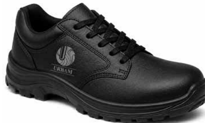
Exemplo de Gravação a Laser